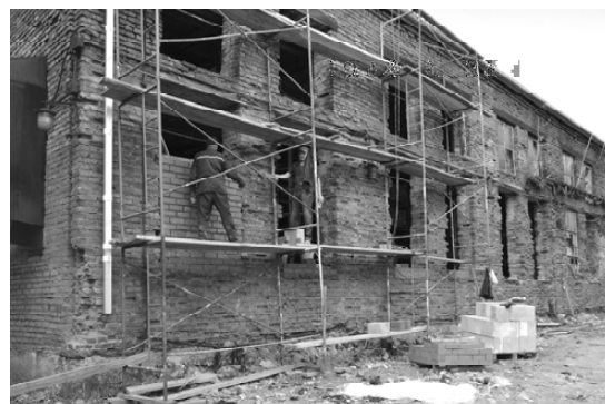
Ремонт здания склада тарной доски