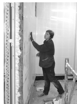
Обновление бытовых помещений в цехе 45