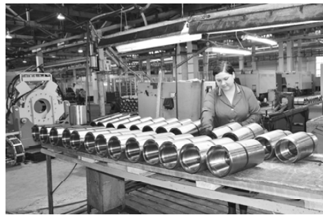
Готовые изделия - на контроле ОТК