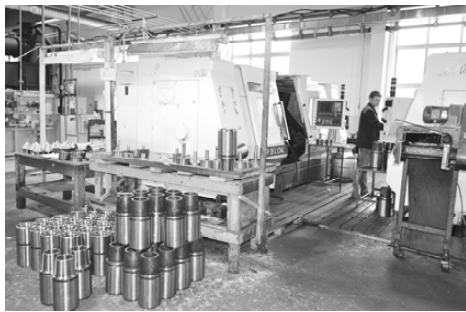
Изготовление замков для бурильных труб

В одном из первых на заводе в цехе 9 в 1986 году была построена сауна с бассейном. Запись на её посещение была на три-четыре месяца вперёд. Большая заслуга в этом нововведении энергетика цеха 9 Э.Г. Эйзенах.