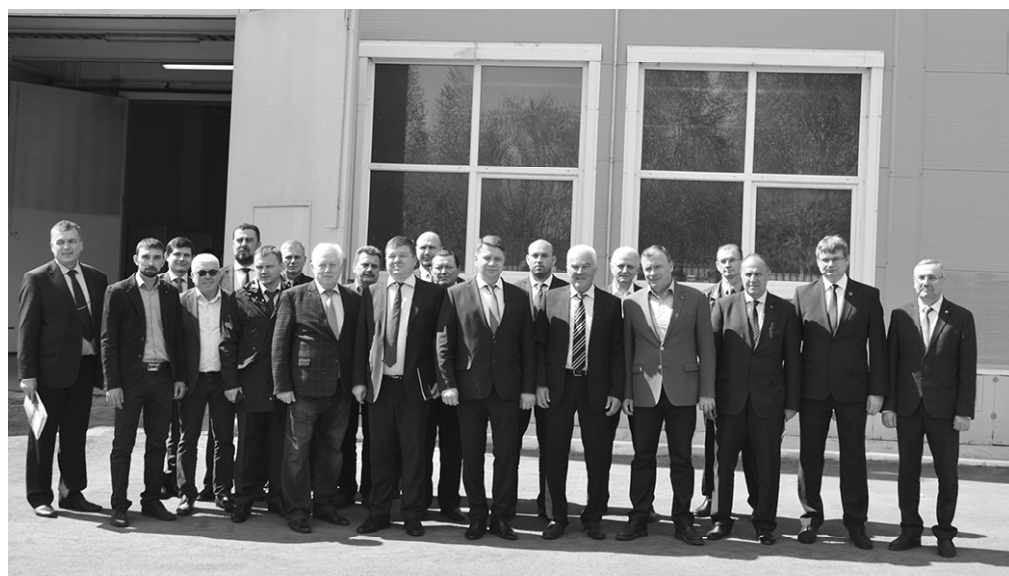
Почетные гости вместе с представителями Серовского механического завода