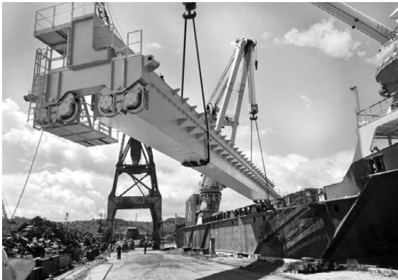
Оборудование погружено на теплоход «Богатырь», который доставит его заказчику.

Уралмашзавод завершил отгрузку двух тяжелых мостовых кранов грузоподъемностью 320 тонн судостроительному комплексу «Звезда» в город Большой Камень в Приморском крае. Это первая в России верфь крупнотоннажного судостроения, способная удовлетворить потребности отечественных заказчиков в строительстве морской техники для обеспечения добычи природных ресурсов на континентальном шельфе. Основные технологические узлы изготовлены в цехах Уралмашзавода, а крупногабаритные детали—на площадке Славянского судоремонтного завода в Приморском крае.