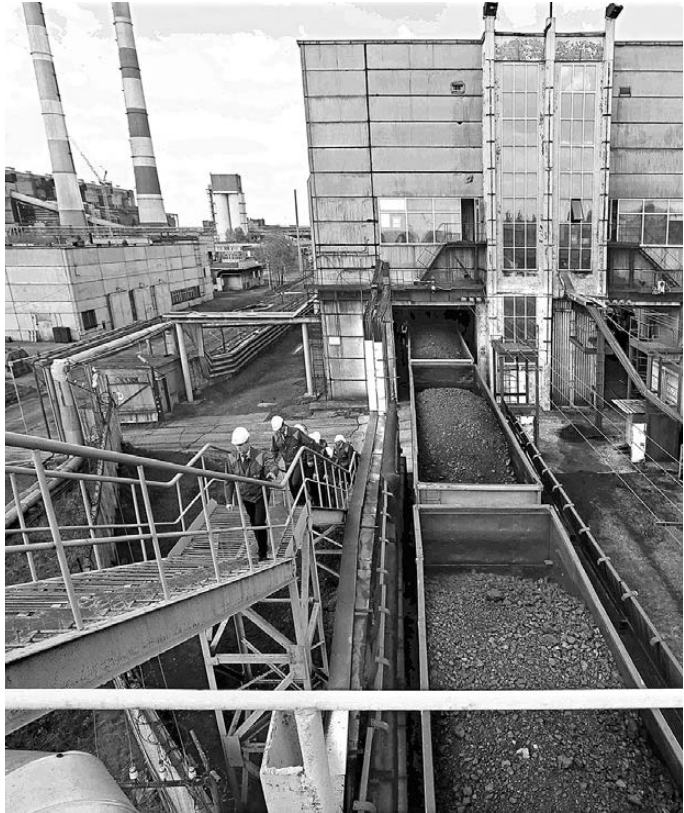
«Аппетит» самой большой угольной станции России таков, что каждые сутки здесь разгружают 10–12 железнодорожных составов с топливом.

Компьютеры также получили Далматовский, Велденский и Курганский детские дома, областная детско-юношеская спортивная школа, Курганский колледж культуры, Курганский областной колледж имени Д.Д. Шостаковича, Петуховский социальный приют для детей, Мишкинский социально-реабилитационный центр для несовершеннолетних, Катайский реабилитационный центр для детей и подростков с ограниченными возможностями здоровья. ●