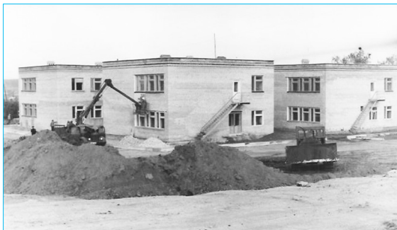
Благодаря совхозу обустривалось село

За 9 лет совхоз построил: автогараж на 25 машин, ремонтную мастерскую на 8 мест, гаражи для стоянки и ремонта техники в каждом