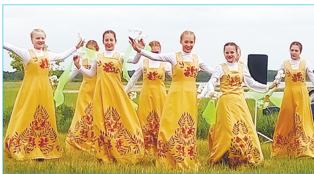
Ансамбль «Сияние» из Покровского порадовал собравшихся своим выступлением