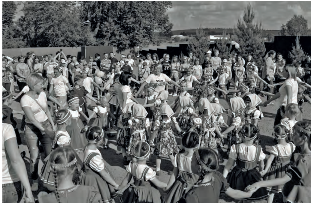
● Хоровод дружбы в Бисертском городском округе

малую Родину, в Свердловскую область, чтобы поздравить земляков с Днём России от себя лично, от всего Центра подготовки космонавтов и отряда космонавтов «Роскосмоса».