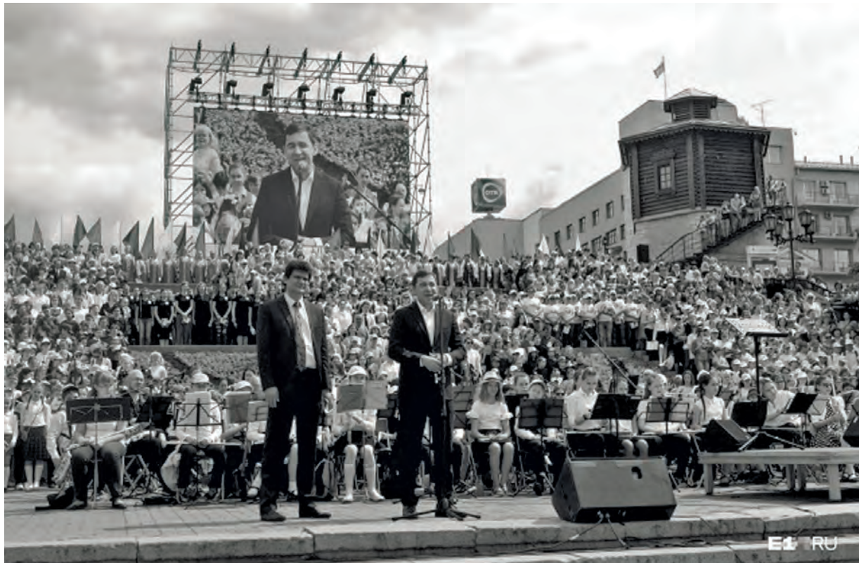
● Губернатор Свердловской области Евгений Куйвашев и глава Екатеринбурга Александр Высокинский на празднике «Хором славим Россию и город»

На праздничных мероприятиях присутствовал космонавт-испытатель отряда космонавтов «Роскосмоса» свердловчанин Сергей Прокöpfeв. Он 12 июня прибыл на