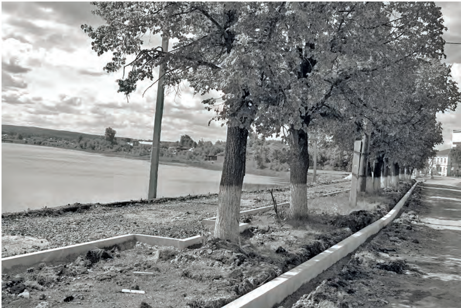
● Набережная. Установлен бордюрный камень автодороги

Не обошлось и без радостных новостей к празднику - Бисертской городской больнице в этом году выделили дополнительные средства на ремонт крыши главного корпуса.