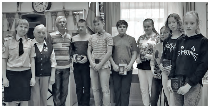
● Вручение паспортов юным жителям Бисерти