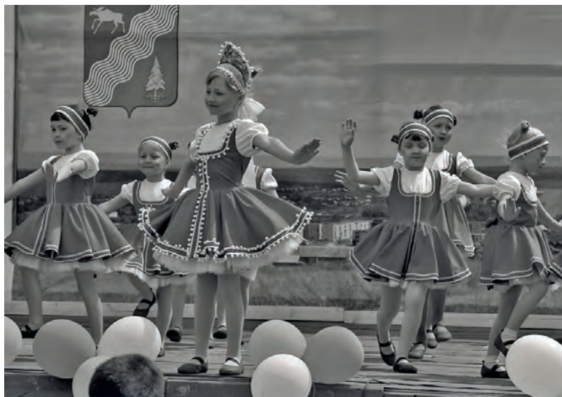
● Праздничный концерт в парке культуры и отдыха