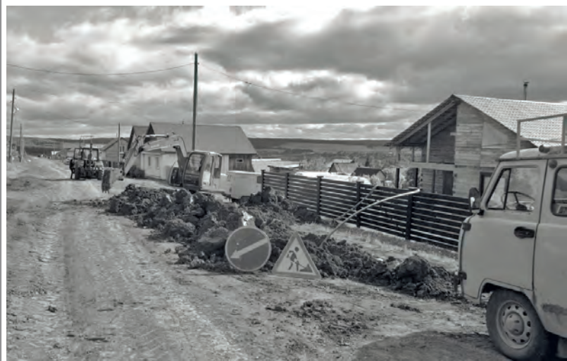
Официально: в Бисерти продолжаются работы по строительству газопроводов. На 17 июня проводятся следующие работы: объект «Газоснабжение р.п. Бисерть. I этап»: прокладка труб газопровода по улицам 8-е Марта и Комсомольская; объект «Газоснабжение р.п. Бисерть. II этап»: прокладка труб газопровода по улицам Пролетарская и Вересовая.

Администрация Бисертского городского округа.