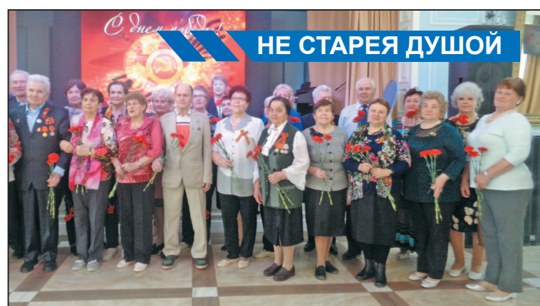
НЕ СТАРЕЯ ДУШОЙ

курсе художественной самодеятельности «Весенняя капель», запомнившись зрителям исполнением «Песенки Маши про варенье» из мультфильма «Маша и медведь». А другие воспитанники садика заняли восемь призовых мест в номинациях: «Театр мод», «Оригинальный жанр» и «Театральное творчество».