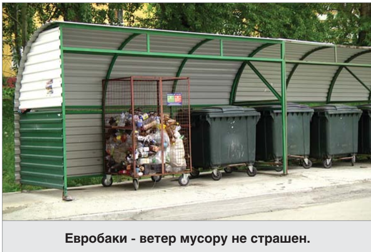
Евробаки - ветер мусору не страшен.

Ежедневно на улицы микрорайона выходят больше двадцати дворников.