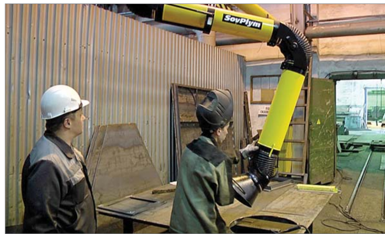
«Рукав» вентиляции сварщик может установить, как ему удобно.

Как правило, всегда оперативно выполняются малозатратные работы по промсанитарии и соблюдению требований охраны труда. Для остальных необходимо больше времени, денег, организационных усилий. Вот свежий пример. В инженерном центре для исключения распространения газов потребовалось изменить режим работы вентиляции в исследовательской лаборатории. Решение было простым и понятным: установить таймер. На оформление заявки, приобретение устройства и его подключение потребовалось два с половиной месяца. Как видите, не всё удаётся сделать быстро.