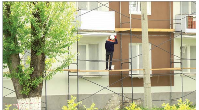
Капремонт дома 24-а, по улице Ильича в самом разгаре.

- К сожалению, нет возможности воздействовать на рекламодателей, которые расклеивают листовки в несанкционированных местах. Несмотря на то, что уборка остановочных