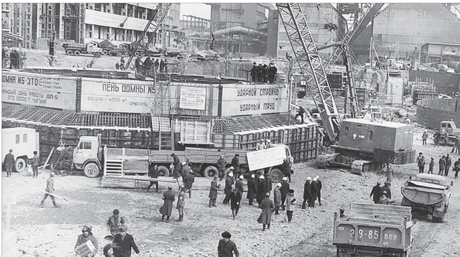
Строительство доменной печи на Череповецком металлургическом комбинате.