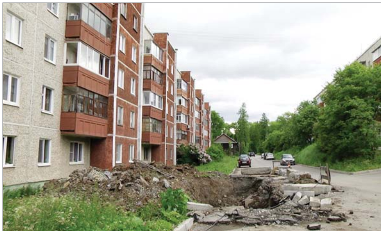
Ремонт теплосетей на улице Свердлова, 6.

Также необходимо отремонтировать 1500 погонных метров межпанельных швов. Площадь кровельных работ составит . – 1280 квадратных метров. Фаса-