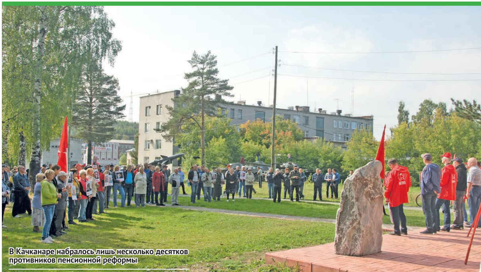
В Качканаре набралось лишь несколько десятков противников пенсионной реформы