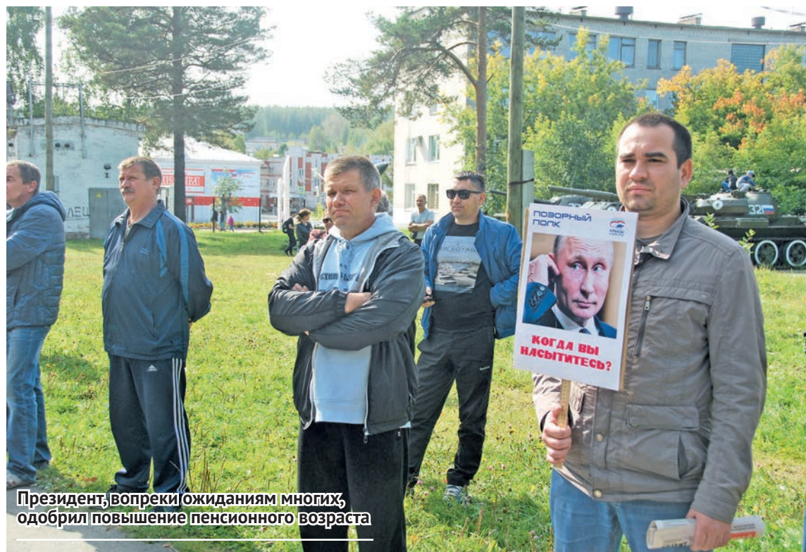
Президент, вопреки ожиданиям многих, одобрил повышение пенсионного возраста

Вот про революцию говорят, да не повторится у нас 1917-й год, у нас нет того на-