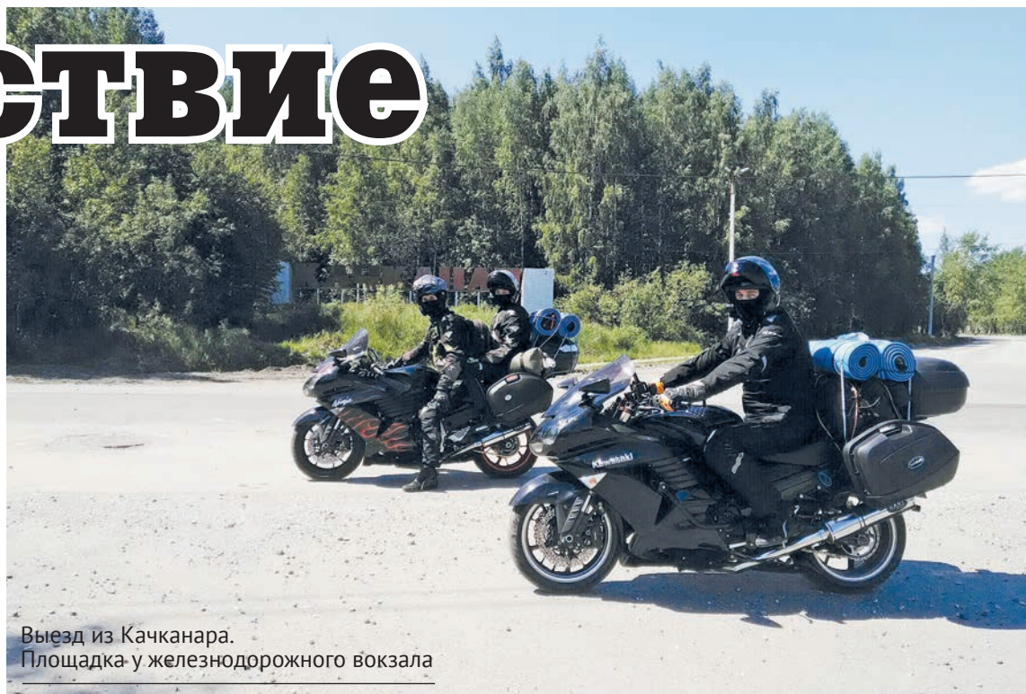
Выезд из Качканара. Площадка у железнодорожного вокзала