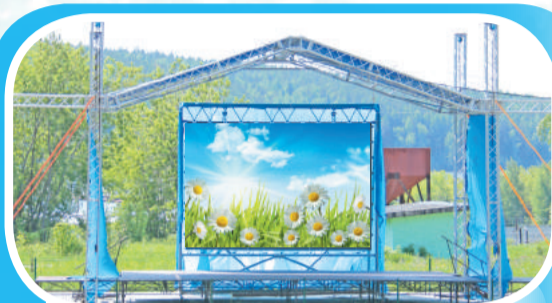
Сценический комплекс ПКиО