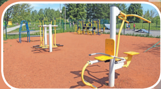
Спортивная площадка ПКиО