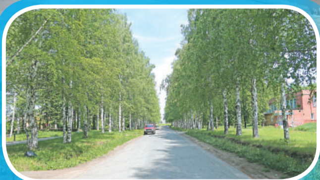
Проезжая часть от Обелиска до КПП