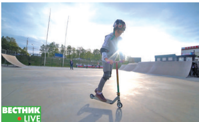
Начинающие трюкачи-экстремалы напоминают о необходимости собственной защиты и безопасности.

Самые распространённые нарушения ПДД водителями велосипедов – это движение навстречу транспортным средствам и движение на велосипеде по пешеходному переходу.