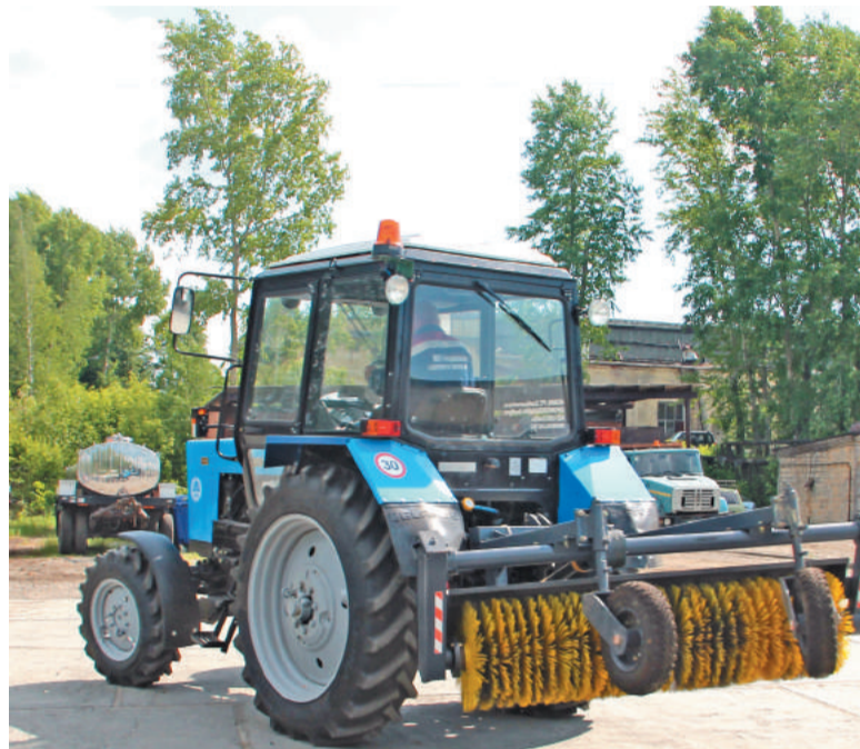
Теперь людям будет удобно работать. А это значит, что и город приводить в порядок станут быстрее.

Дарья СВЕТИЧНАЯ. По информации администрации городского округа «Город Лесной».