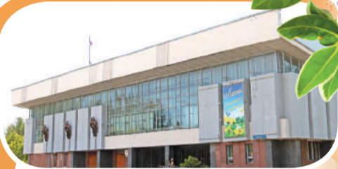
Площадь у Дома творчества и досуга «Юность»