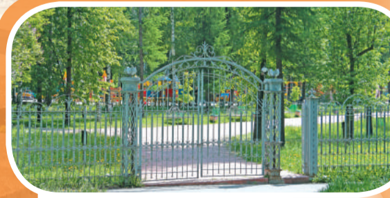
Входная группа ПКиО