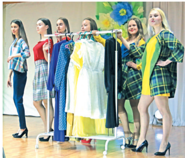
Юные модельеры студии «Ателье» ЦДТ представили коллекцию одежды, приготовленную к 70-летию отрасли.

Десять лет в этом году исполняется созданному по инициативе бывших сотрудников ОРСа и поддержанному администрацией города Совету ветеранов торговли и общественного питания – сплочённому коллективу, избранному из работников бывших подразделений ОРСа комбината «Электрохимприбор».