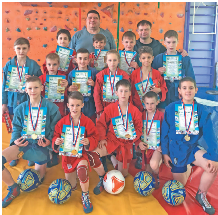
Юные самбисты из ДЮСШ Лесного.