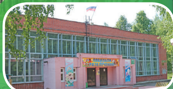
Павильон игровых автоматов ПКиО