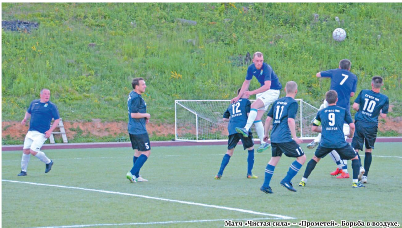
Матч «Чистая сила» – «Прометей». Борьба в воздухе.