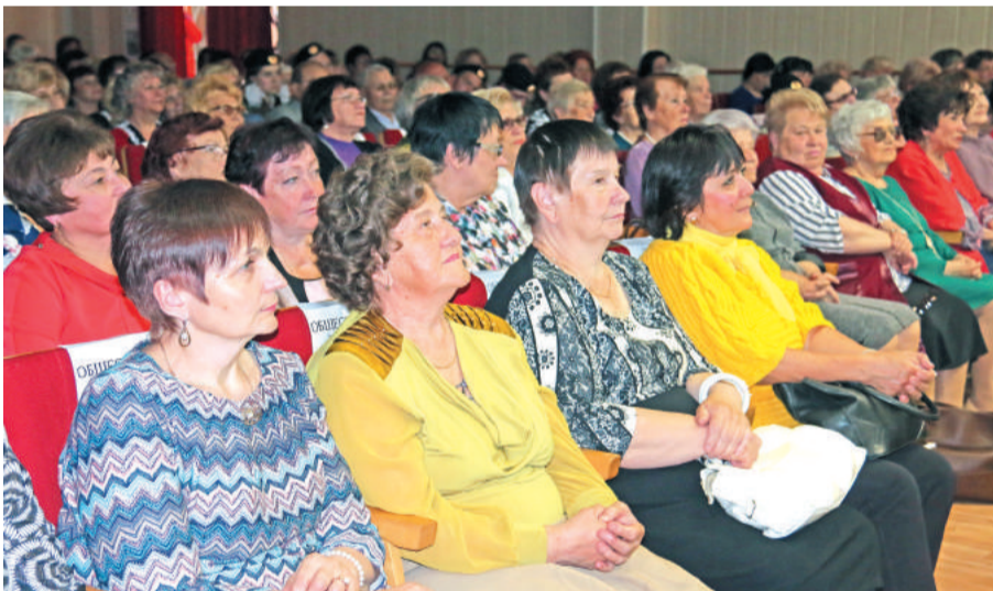
Ветераны торговли и общественного питания нашего города.

Чудесным презентом для всех гостей вечера были выступления творческих коллективов города, так искусно и тонко вплетённые в сценарий вечера. Ну а приятным и вкусным сюрпризом стал большой торт, приготовленный умелыми кондитерами 900 отдела комбината «Электрохимприбор».