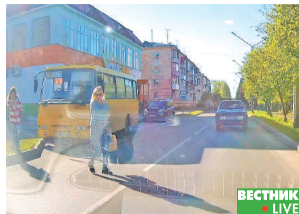
«Проезжай!» – кричит нарушительница ПДД... Автобус обошла неверно, пересекает дорогу в зоне видимости пешеходного перехода, вынудила транспортное средство совершить экстренное торможение, создав тем самым опасную ситуацию, которая могла привести к ДТП. Благо, что «Скорая помощь» рядом.