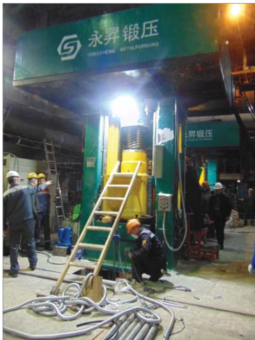
Монтаж китайского прессы в цехе №2 произведён по проекту заводских конструкторов.

тежи по вышеназванным объектам уже отданы специалистам ремонтно-строительного управления для проработки, составления заявок на приобретение материалов.