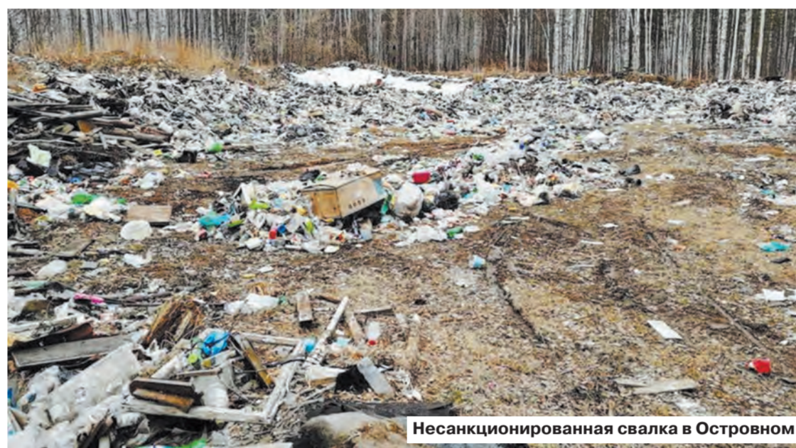
Несанкционированная свалка в Островном

А какие еще изменения нас ждут: реформа затянута не только для того,