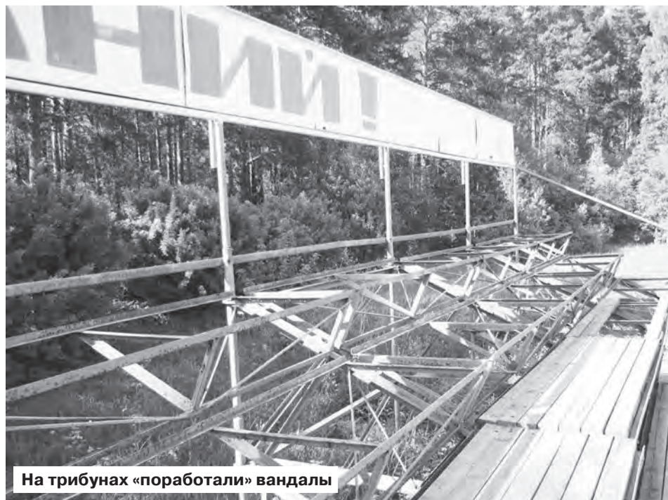
На трибунах «поработали» вандалы

В настоящее время мы изучаем практику других муниципалитетов по созданию современных спортивных площадок, чтобы нам привлечь на стадион людей разного возраста.