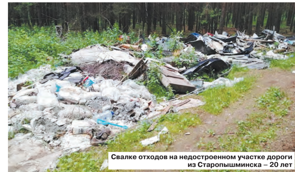
Свалка отходов на недостроенном участке дороги из Старопышминска – 20 лет

В будущем у нас появятся 13 мусоросортировочных комплексов, так, в Нижнем Тагиле – на 185 тысяч тонн, еще один в Краснотурьинске, в Новоуральске откроется линия на 50 тысяч тонн, два завода на 800 тысяч тонн с полигоном построят для переработки ТКО Екатеринбургa, Берёзовского, Верхней Пышмы, Среднеуральска, Дегтярска и Двуреченска.