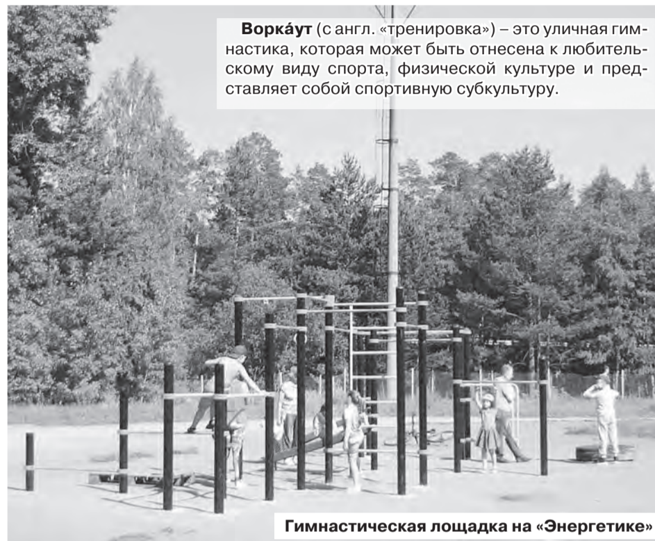
Воркáут (с англ. «тренировка») – это уличная гимнастика, которая может быть отнесена к любительскому виду спорта, физической культуре и представляет собой спортивную субкультуру.

«Энергетик» при ближайшем рассмотрении оказался и таким, и не таким, как его описали редакции по телефону местные любители активного образа жизни. Поле более-менее ухожено, мусора на нем не было, здание не выбивалось из пейзажа, портили картину нескошенная трава на газонах,