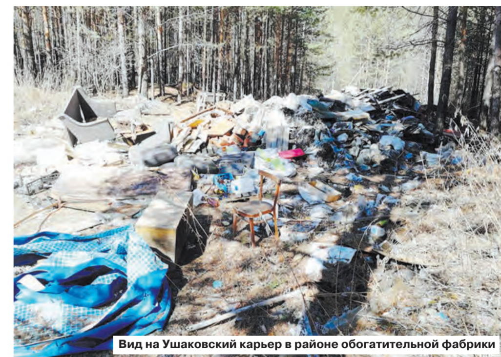
Вид на Ушаковский карьер в районе обогатительной фабрики

Будут модернизированы заводы в Первоуральске, Каменске-Уральском, небольшие линии появятся в Асбесте, Байкалово, в Краснофимске построят новый полигон вместо старого. Но на