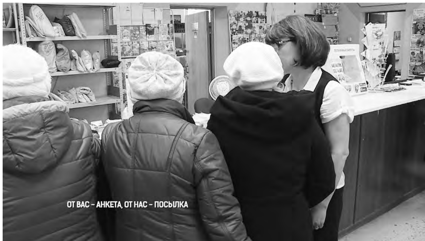
ОТ ВАС – АНКЕТА, ОТ НАС – ПОСЫЛКА

Везде выбрав ответ «нет» и благополучно получив свою посылку, я решила твердо больше на Почту России не ходить. Я ничем не обязана этому