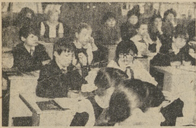
Многими интересными делами известны в городе пионеры школы № 3.