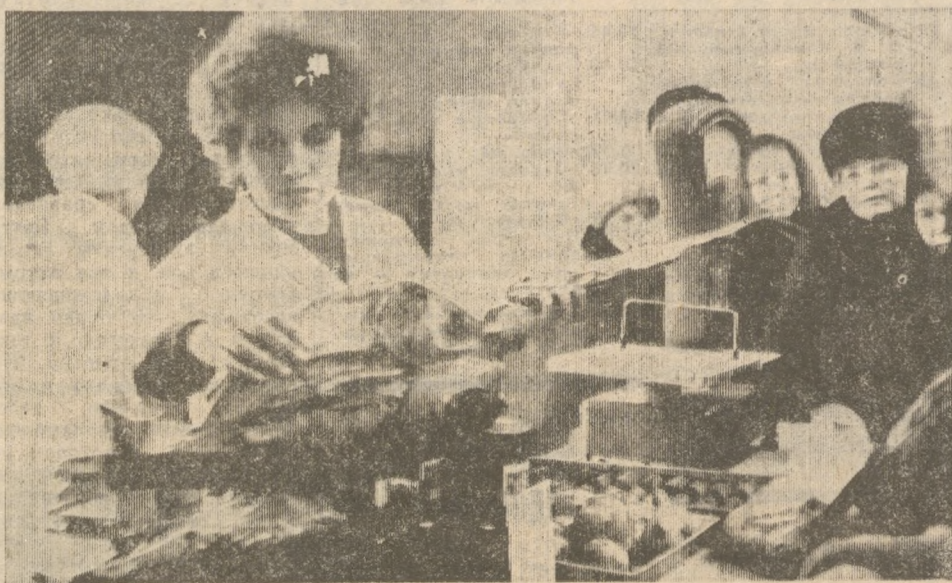
В «СЕЛЬХОЗПРОДУКТАХ» ПРАЗДНИК: ПРИВЕЗЛИ РЫБУ.