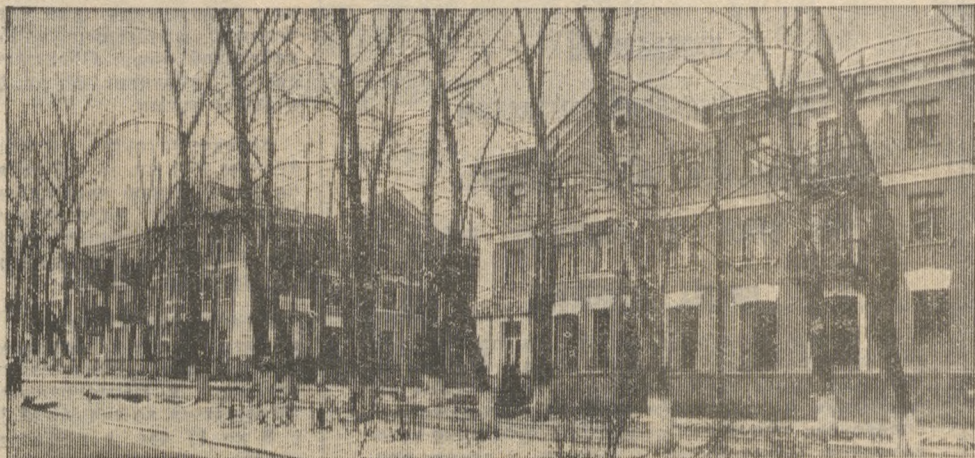
Улица Ильича — центральная в поселке Динас.