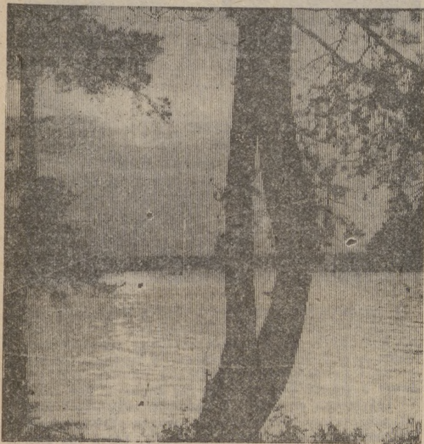
ПРУД И ОСЕНЬ.