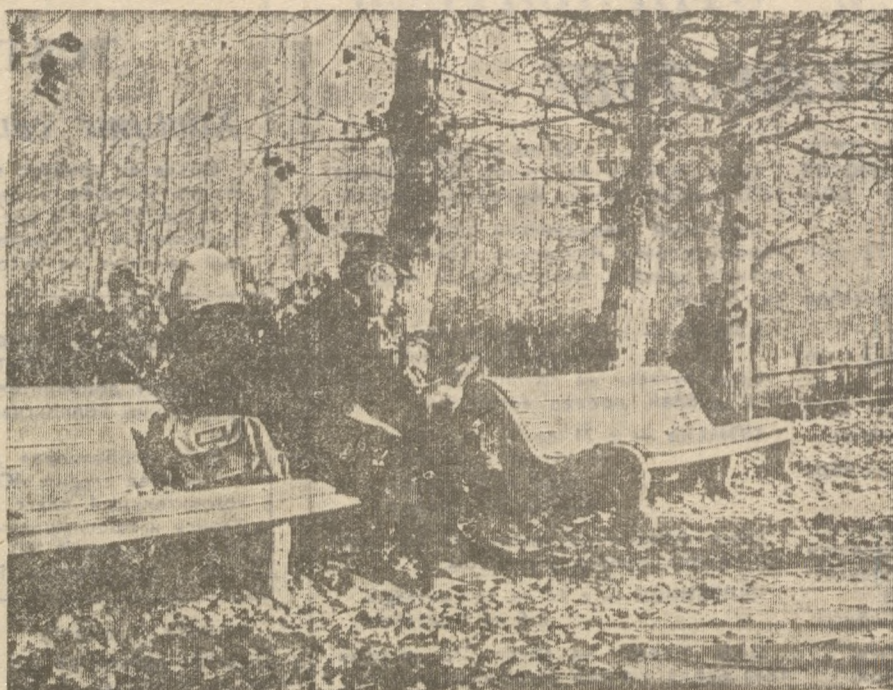
ОСЕНЬ В ГОРОДЕ.