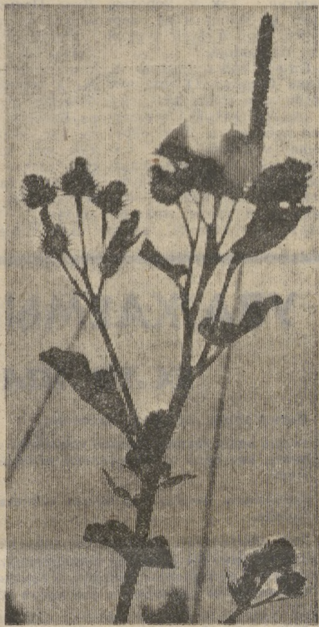
Редактор В. И. ПРУДНИКОВ.

Самые скромные сухие ветки деревьев, стебли злаковых, растения сада и леса, мхи, составляющие букеты и различные композиции, в отличие от цветов бумажных, сделанных из стружек, шелка, поролон, внесут в вашу зимнюю квартиру особое настроение.