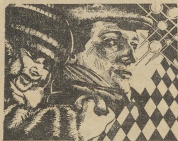
МОЙ ЛЮБИМЫЙ КЛОУН

12 — 17 мая демонстрируется художественный фильм по мотивам одноименной повести В. Ливанова. Авторы сценария Александр Адабашьян, Никита Михалков. В ролях О. Меньшиков, О. Стриженов, Т. Догилева, Н. Сайко и другие.