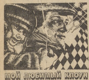
МОЙ ЛЮБИМЫЙ КЛОУН