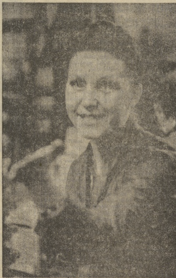
О ДЕЛАХ И ЛЮДЯХ ЗАВОДА «ИСКРА» ЧИТАЙТЕ НА 3-й стр.