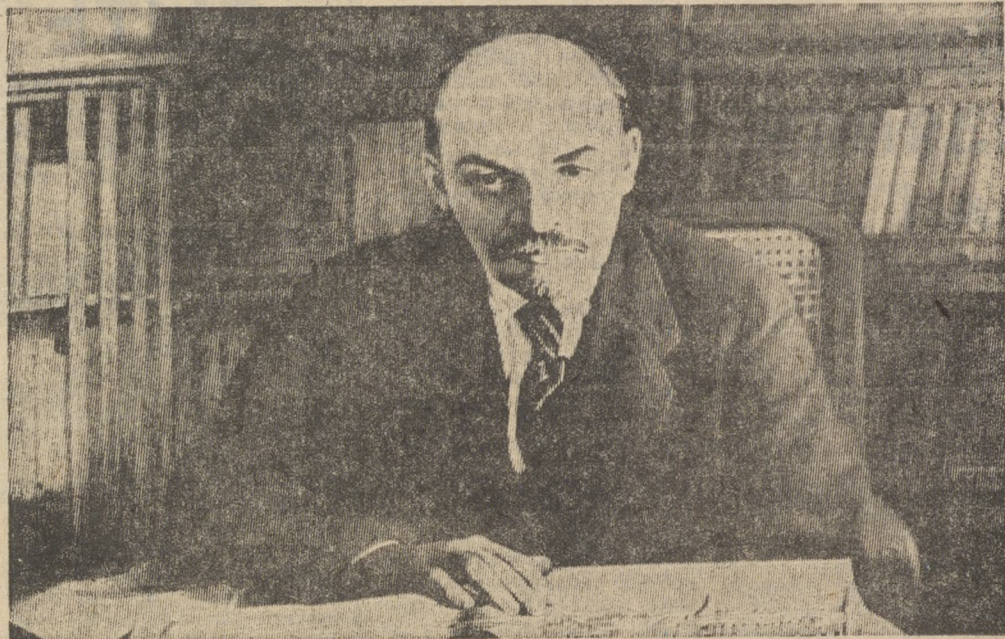
ВЛАДИМИР ИЛЬИЧ ЛЕНИН.