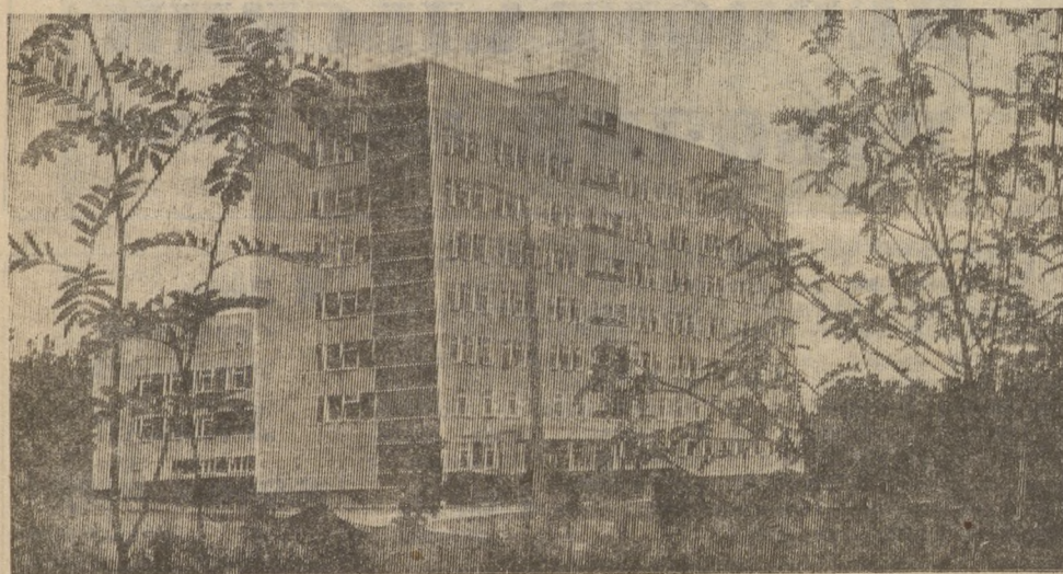
Силуэты родного города