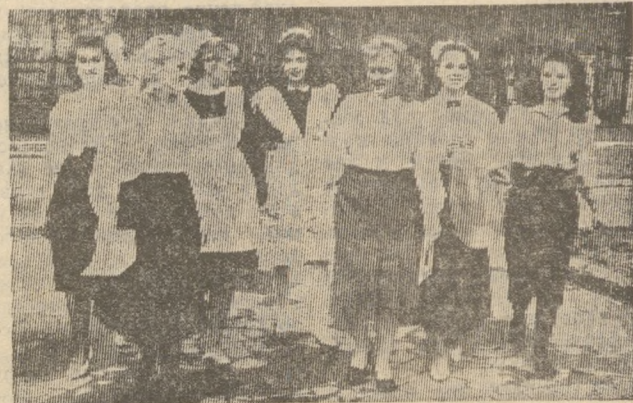
«Последний звонок — самый грустный из всех школьных праздников»...