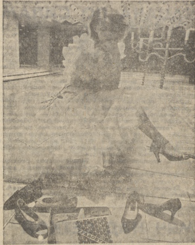
Свердловск. Отдельные модели производственного объединения «Уралобувь» пользуются у покупателей меньшим спросом, чем лучшие зарубежные образцы. Но, к сожалению, лишь отдельные. Сегодня торговля возвращает на предприятие до 12 процентов обуви, штрафные санкции достигают сотен тысяч рублей в год. Почему?