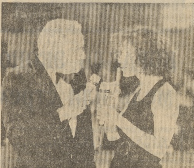
На снимке: советская актриса Наталья Негода и американский актер Джен Леммон во время церемонии вручения премии американской академии киноискусства «Оскар» в Москве.

Против легендарных японских «ниндзя» — профессиональных воинов, которые, как говорят, не только непревзойденно владеют мечом и отличаются фантастической ловкостью, способны даже становиться невидимыми, неизвестно откуда появляясь и непонятно куда исчезая, вот против них и выступает аме-