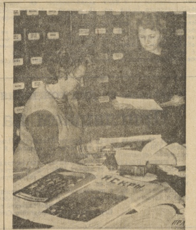
На снимке: в фондах Ленинградского филиала Центрального музея Владимира Ильича Ленина ведется подготовка материалов к выставке, посвященной 120-летию со дня рождения основателя первого в мире государства рабочих и крестьян. (Фотохроника ТАСС).

Для чего все это задумано? Для того, чтобы обеспечить высокую степень самостоятельности Урала как территориально-экономического региона России. А. КИПРИАНОВА.