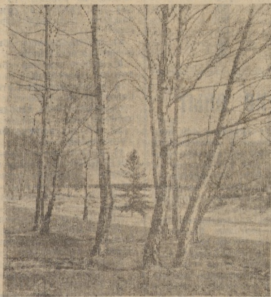
В ЛЕСУ НА ОПУШКЕ.