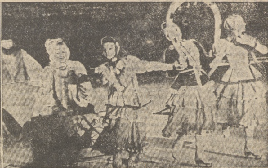
■ ПОСЛЕСЛОВИЕ И ГАСТРОЛЯМ ЛЕНИНГРАДСКОГО БАЛЕТА НА ЛЬДУ