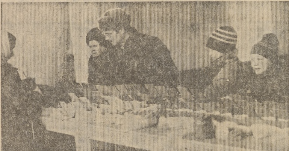
Приближается горячая пора для садоводов — весенние работы на участках. А пока еще на улице снег, необходимо позаботиться о семенах. На городском рынке выбор их большой. 24 марта открылся киоск, в котором покупателям предложен широкий ассортимент семян. За несколько дней товарооборот нового хозяйственного киоска составил месячную норму. Да еще и конкуренты рядом — частники...