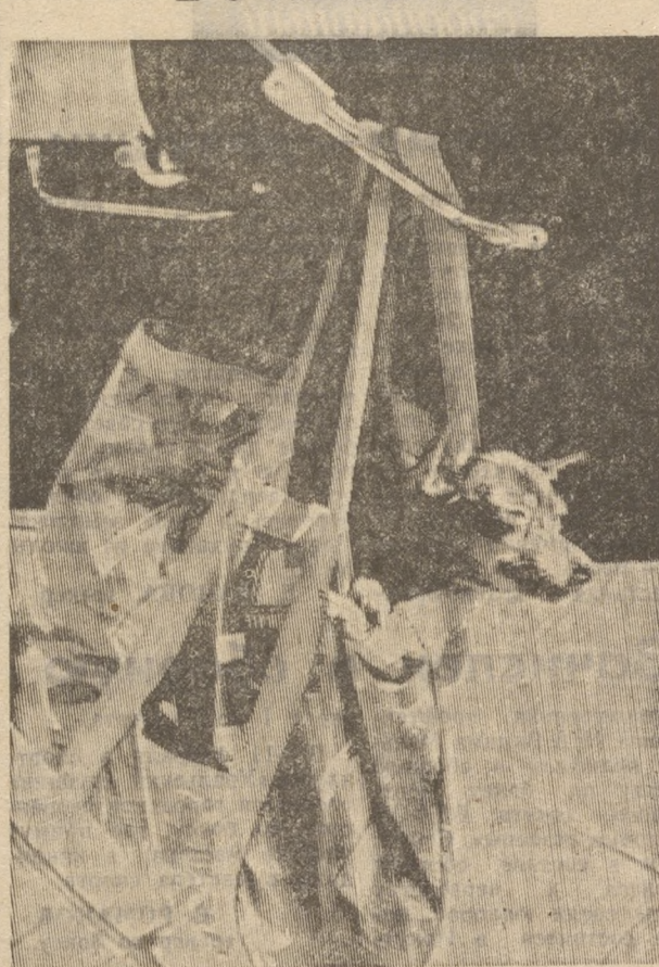
Из породы сумчатых.