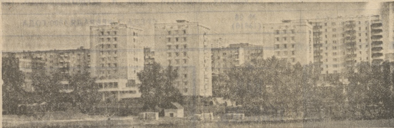
На снимке: набережная Нижнего пруда. По словам главного архитектора В. А. Кухты, здесь будет центр города.