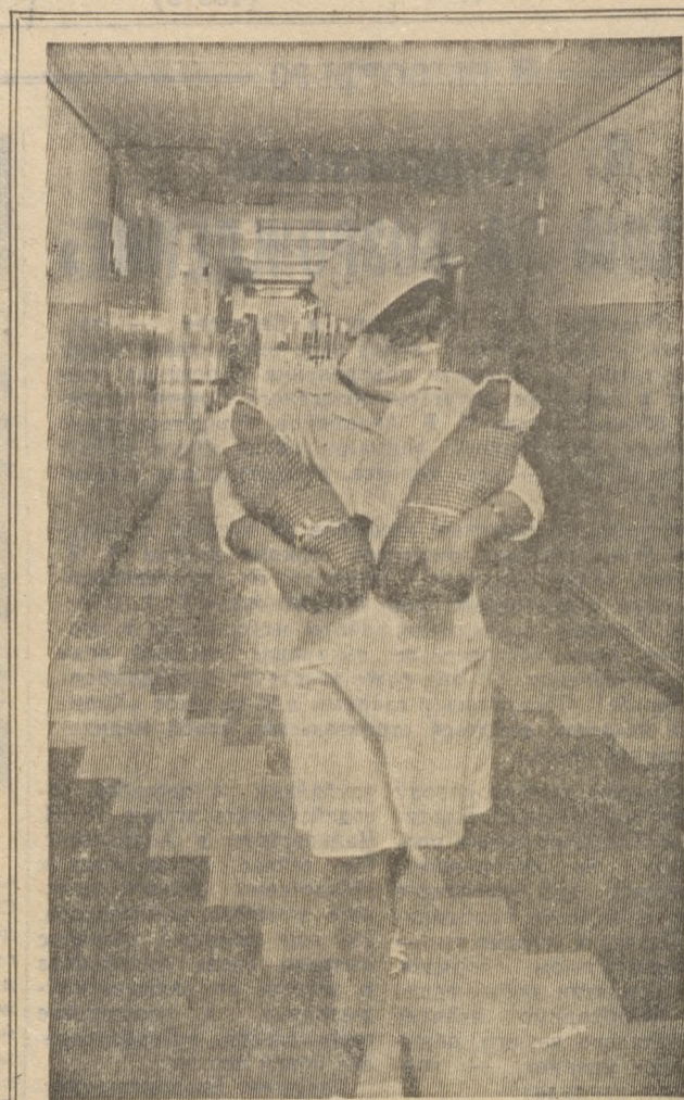
Здоровыми ли вырастут эти дети!

ем за социальную справедливость. Каждый центр должен иметь в своем составе клинические стационарные отделения и сеть поликлинических кабинетов. Программа перестройки здравоохранения города рассчитана на три года, она уже идет, и сделано немало. Но чтобы ее выполнить, надо решить следующие проблемы. Кадры: не хватает 375 врачей. (И это при том, что в США их численность на 10 тысяч населения почти вдвое меньше!) Из-за недостатка специалистов нет возможности укомплектовать специализированные центры. Люди не держатся из-за отсутствия жилья и низкой оплаты труда (кроме хирургов и гинекологов). По последней причине наблюдается отток в медицинские кооперативы. По обеспечению кадрами мы в области на пятом месте среди городов с населением свыше ста тысяч.