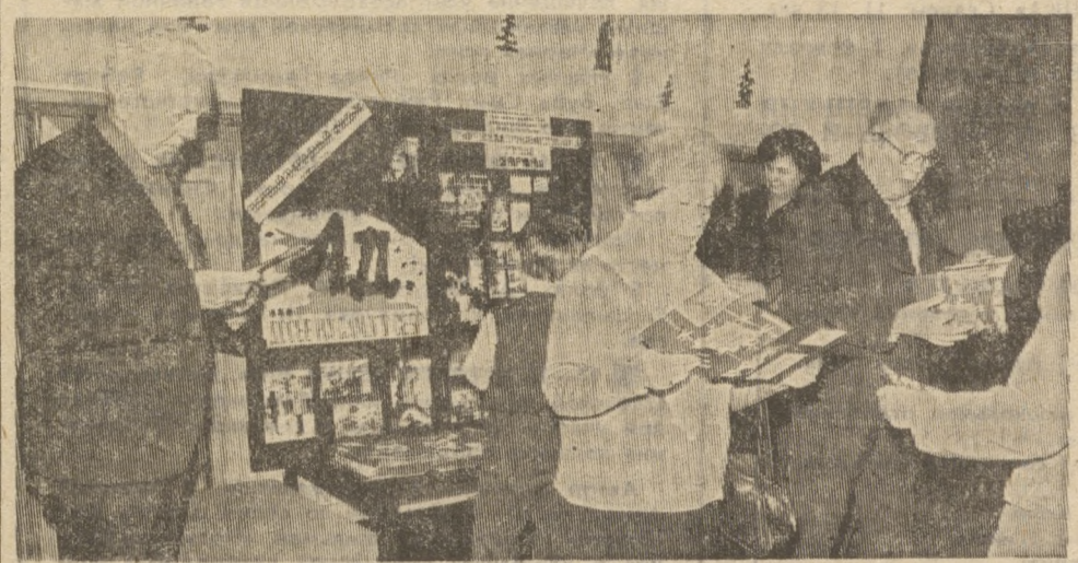
«Ад, или Досье на самого себя»

Это лишь фрагменты беседы. Разговор вышел в тот вечер далеко за отведенные ему временные рамки. Звучали разные предложения, мнения. Но сводились они к одному: создание подобного спортивно-технического комплекса не могло бы не сказаться на уровне молодежных правонарушений. Что ж, будем надеяться, что в лице авторитетных собеседников идея получила сторонников. Но заручиться поддержкой — это еще не все, нужна кропотливая работа. И она началась.