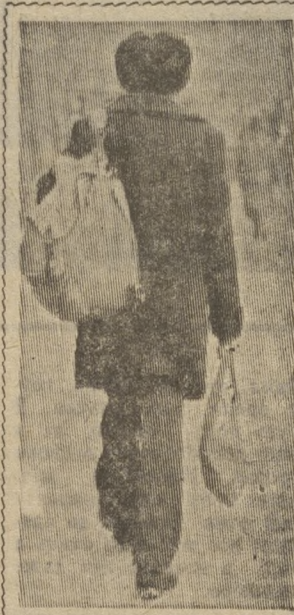
На снимке: «Говорят, что в моде сейчас рюкзаки, которые не мешают носить кошелки». (М. Жванецкий).

Эта задача стояла перед органами народного контроля в прошлом, стоит и сегодня, только значительно острее и масштабнее. Поднять эффективность контроля — значит вести усиленную бескомпромиссную борьбу против бесхозяйственности, расточительства, расхлябанности, бюрократизма и волокиты, бездушного отношения к нуждам трудящихся. Выявление резервов, обнаружение недостатков еще не говорят об эффективности контроля. Это всего лишь начало деятельности. Основная же задача дозорных — добиться устранения недостатков.