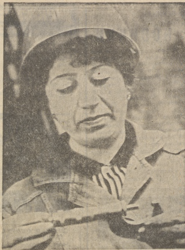
СОВЕТСКОЙ ПОЖАРНОЙ ОХРАНЕ 69 ЛЕТ