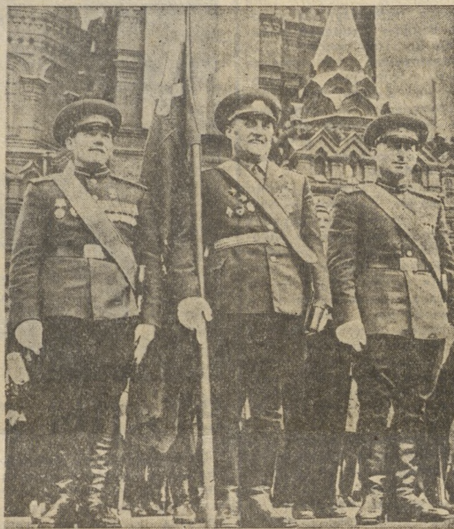
На снимке: Герои Советского Союза участники штурма рейхстага М. А. Егоров, К. Я. Самсонов и М. В. Кантария на Красной площади в Москве в день двадцатилетия Победы над фашистской Германией.