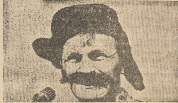
ЧТО «БАЛАСНИК» ПОДМЕТИЛ