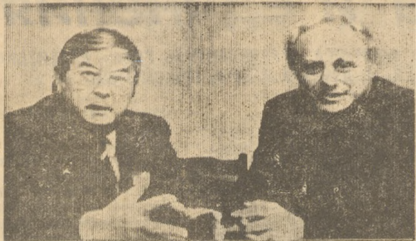
КОНКУРС «РУКОВОДИТЕЛЬ ГОДА»