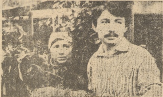
ТАМ, ГДЕ ВСЕГДА ЛЕТО