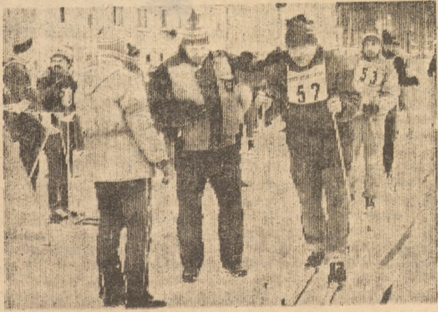
Редактор В. И. ПРУДНИКОВ.