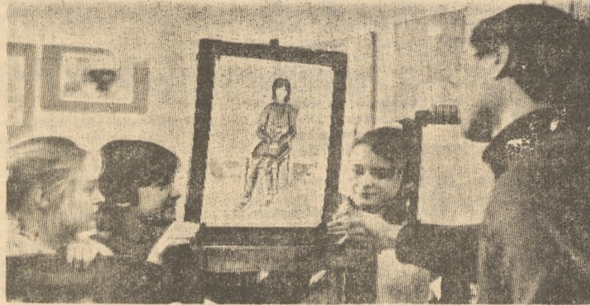
В ДЕТСКОЙ ХУДОЖЕСТВЕННОЙ ШКОЛЕ