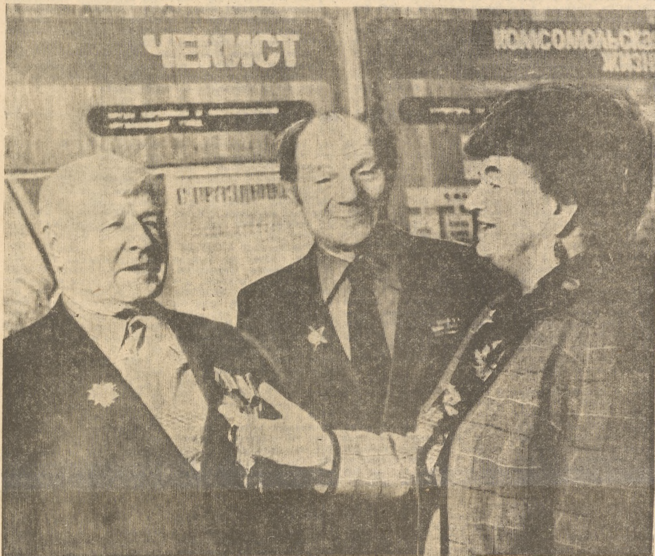
■ ЧЕГО МИЛИЦИИ НЕ ХВАТАЕТ