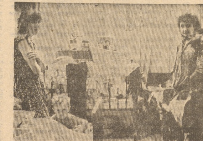
Этот снимок сделан в женском общежитии Новотрубного завода. Стоит ли после того, как познакомишься с бытом молодых семей, удивляться, почему так неохотно молодежь общественной принимает участие в голосовании? Городской комитет комсомола считает, что проблемы молодых лучше смогут решить депутаты от молодежи. Но ведь и в нынешнем составе городского Совета очень много молодых депутатов, это предсказывалось и тогда, когда кандидаты выдвигались «по разнарядке». Значит, в ваших руках, молодые, выдвинуть в депутаты местных Советов истинных борцов за свои права.