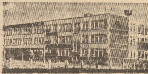
Новая школа по улице Комсомольской.