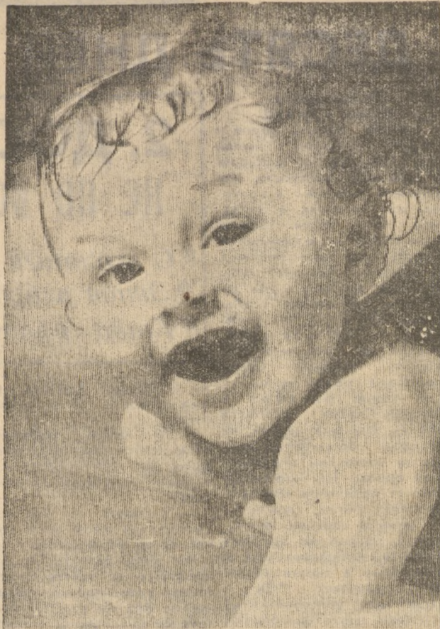
Я так люблю плавать.