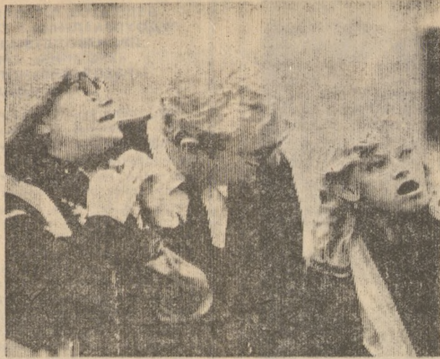
МОСКВА. На Кузнецком мосту, 11 открылась выставка картин художников США «Живопись умерла, да здравствует живопись».