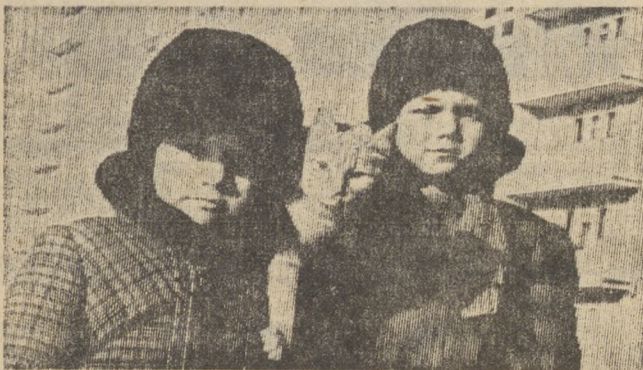
Интересную картину наблюдал наш фотокорреспондент. Игруют мальчишки, возятся в снегу, а у одного на плече — рыжий веселый котенок; вспиhsал острыми коготками в мягкий воротник и катается на шее у хозяйки, дружит и с другими ребятами. Вот как охотно позируют перед фотообъективом три приятеля!