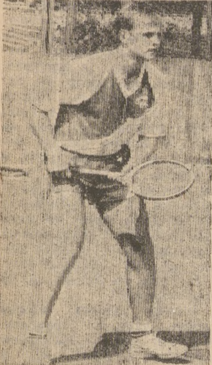
Решающая секунда.