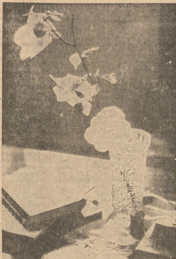
РОЗЫ НА СТОЛЕ.