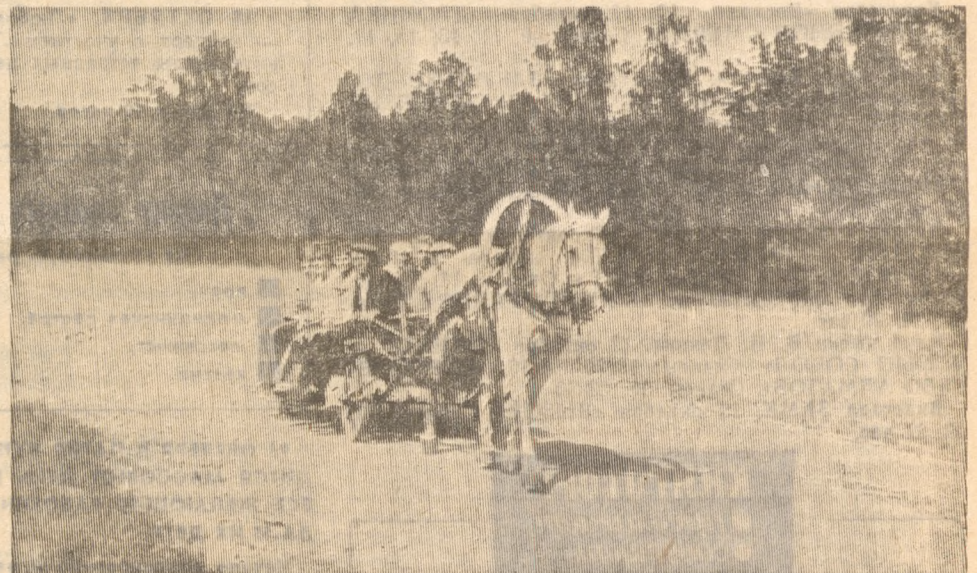
На проселочной дороге.