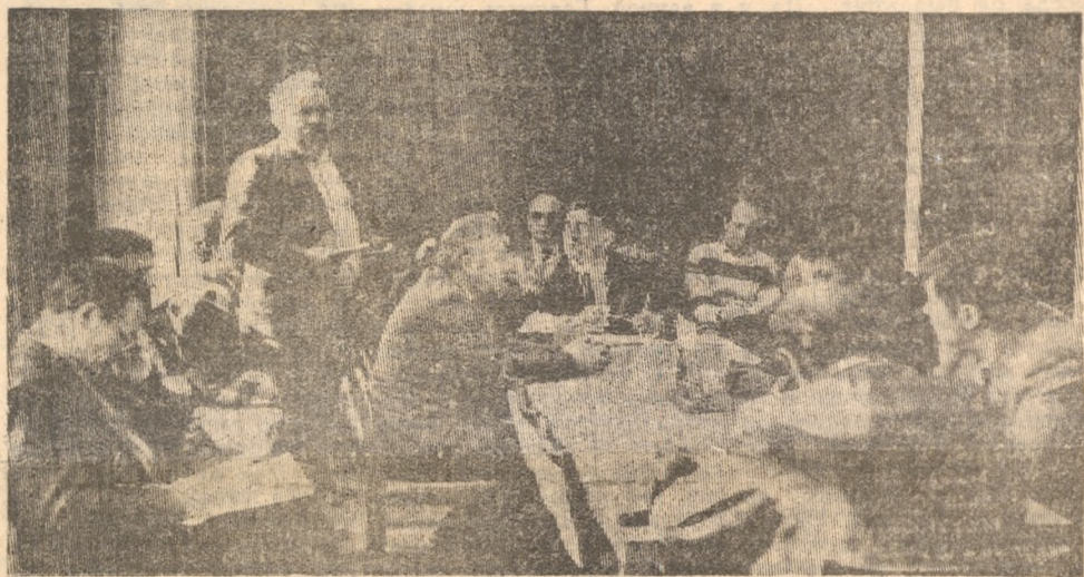
Уборка — дело нешуточное даже для многотысячного коллектива Новотрубного завода.

свой отряд комсомольским. А если уж назвали, то марку выдержите. А заводу, конечно, что? Мы слово сдержали. Приказ я подписала: по сто рублей премии грузчиком и даже водителям. Вас вознесли наверх, а другие — ладно, обойдутся. Ошибку сделали.