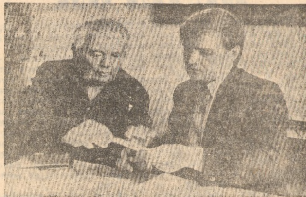
Надо помочь ветерану.