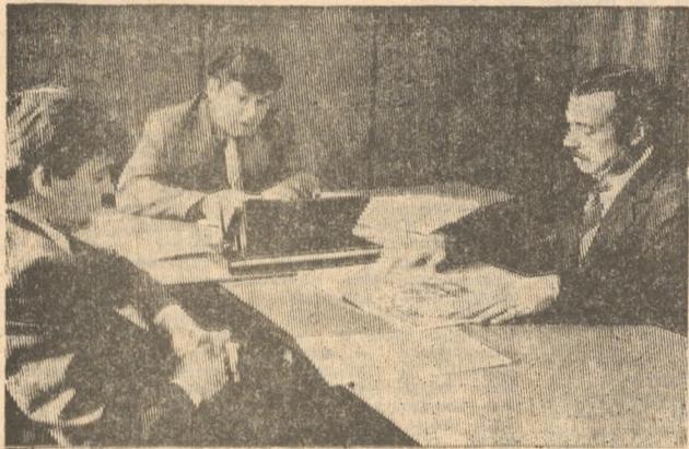
Народному депутату СССР Павлу Павловичу Пьянкову успеть бы наказать самое главное.

После этой фразы отметили для себя, что партийный комитет приобрел в последние годы искренность, отказавшись от показухи. А нам-то она тем более не нужна.