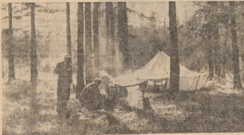
3. Три дня по шесть часов в день шли через перевал. Невезучий Рома чуть не свалился в пропасть вместе с грузом, а потом потерял подношью... Зато сладостными были часы ночного отдыха у костра в палатке, вкусным был ужин.