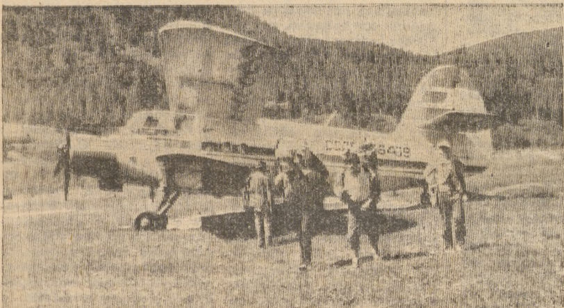
1. Поезд «Москва—Тында» доставил первоуральцев до Нижне-Удинска, где, пересев на крошечный АН-2, они добрались до звероводческого совхоза Верхней Гутары.