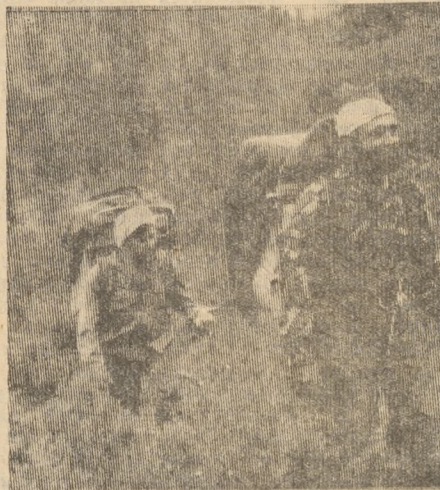
5. У Чертова моста через ущелье реки Кшиты распрощались с проводником-каюрором, который повел лошадей назад. Вновь приняв на плечи груз, экспедиция двинулась к Казыру.