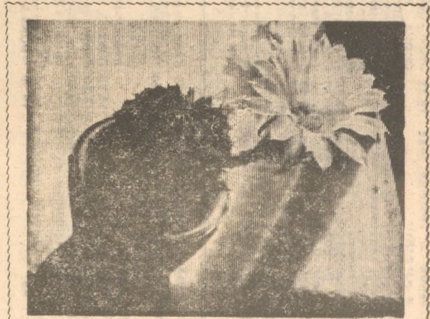
КАКТУС ЦВЕТЕТ ОДИН ДЕНЬ.

Редакция поздравляет победительницу и ждет ее для вручения почетного приза — книги Ивана Ефремова «Час быка». Мы также приглашаем заинтересованные в рекламе организации и кооперативы принять участие в конкурсе в качестве спонсоров.