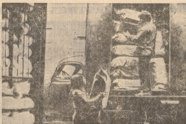
Грузится готовая продукция.

Дата рождения комсомольско-молодежного предприятия «Каутекс», который находится на территории объединения «Хромпик», — 31 марта 1989 года. До этого «Каутекс» был кооперативом. Сегодня здесь выпускают пятилитровые полиэтиленовые канистры. Эффект от создания хозрасчетного предприятия определить нетрудно. Прежде участок выполнял только госзаказ, за прошедшие полгода выпущено дополнительно продукции на 170 тыс. рублей. Шестьдесят процентов вырученных средств поступило в различные фонды, часть перечислена на счет в банк, пять тысяч рублей передано в распоряжение комитета комсомола «Хромпика». Вот такая арифметика. Сейчас осваиваются еще трехлитровые канистры. Через месяц в продажу поступят 200-граммовые полиэтиленовые стаканчики. У «Каутекса» есть задумка делать свою продукцию цветной. О том, что представляет собой предприятие, рассказывается на этой странице.